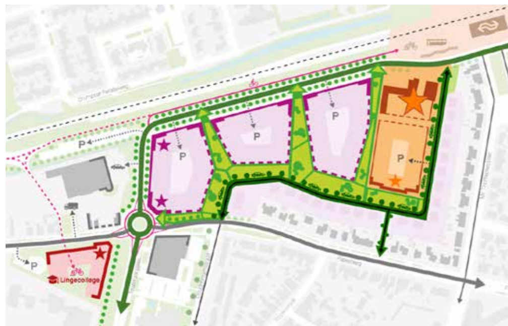
Gebiedsvisie Veilingterrein en Beroepscollege