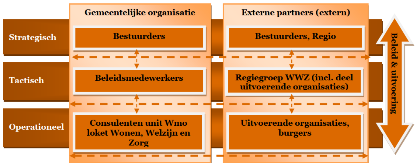
Figuur 2. Organisatorische context Wmo in Tiel, Rekenkamer Tiel (2011).

De Wmo is een brede wet, waarbij verschillende organisatieonderdelen van de gemeente Tiel betrokken zijn. Ook zijn er partners betrokken. Dat geldt zowel voor de beleidsvorming als de uitvoering van het beleid. In onderstaand overzicht is de organisatorische context op hoofdlijnen weergegeven.